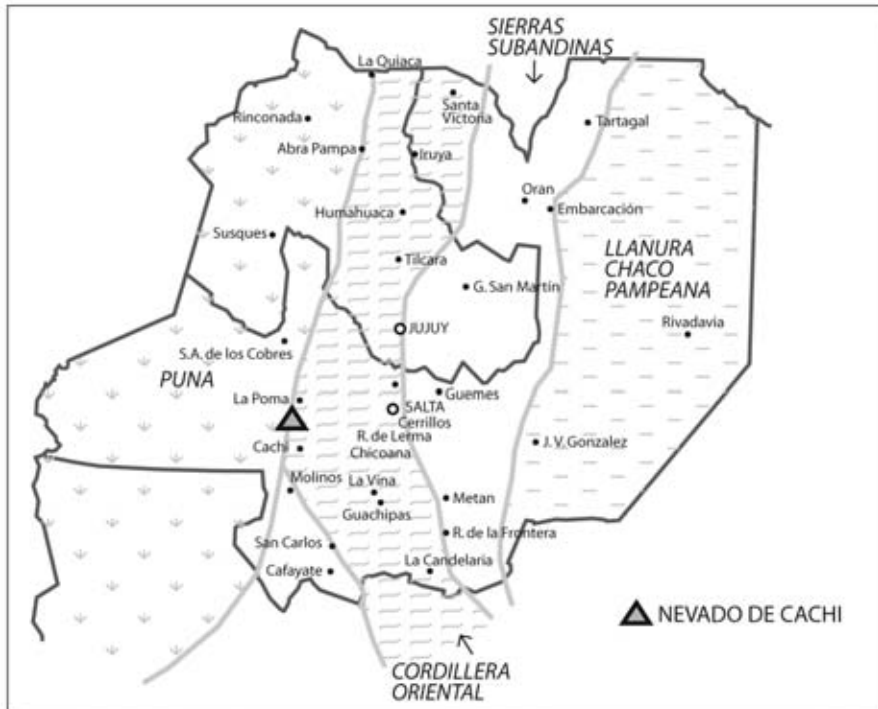
Mapa 3: Regiones morfoestructurales del NOA. Ubicación de la Cordillera Oriental y borde de La Puna donde se encuentra el Nevado de Cachi.

El nevado de Cachi está situado al Oeste-Suroeste de la ciudad de Salta, a casi 100 km. en línea recta, y a 186 km. Transitando por las rutas provinciales 59 y 33. Está íntegramente ubicado en el Departamento de Cachi, en su sector Oeste, y sus coordenadas geográficas aproximadas son: 66° 23' Longitud Oeste y 24° 57' Latitud Sur.